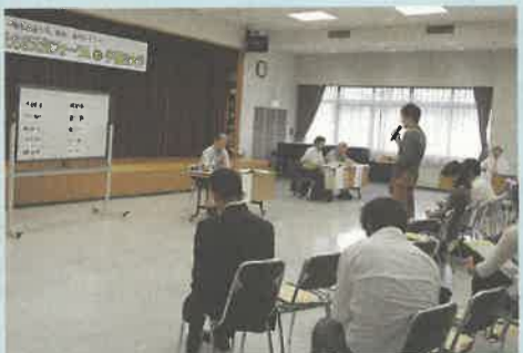
ただいま8月開催の参加者を募集しています。詳しくは3面のお知らせをご覧ください