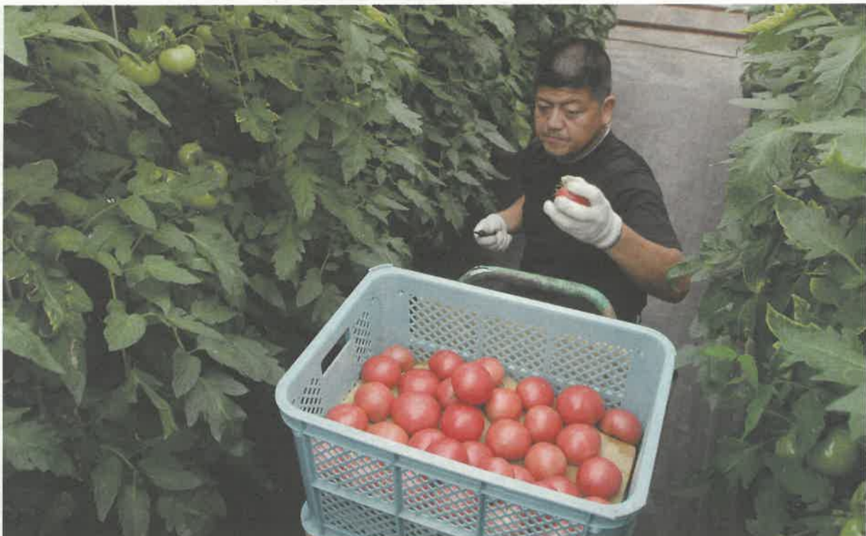
真岡市の獅毛農園では、農薬や肥料の適正管理などにより、人にも環境にもやさしいトマトを生産しています

編集・発行 栃木県広報課 平成21年7月15日発行 目次 2面 “とちぎ発”ストップ温暖化アクション 3面 県からのお知らせ・地域のおたより 4面 吹き竹・県政トピックス・文化情報 ほか 〒320-8501 宇都宮市埜田1-1-20 TEL 028-623-2192 FAX 028-623-2160 栃木県のホームページ http://www.pref.tochigi.lg.jp/