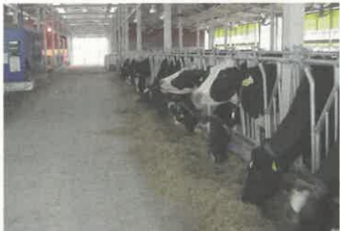
家畜を衛生的な環境で飼育しています

が大切です。このため、県では、畜産農家に対して、畜舎の清掃や消毒の徹底、家畜の健康状態の観察や病気の予防に関する知識の習得など、法律に定められている家畜の飼養衛生管理基準について指導しています。また、家畜に食べさせている工サや、治療に使う薬の検査を実施し、その品質や安全性などについてもチェックしています。