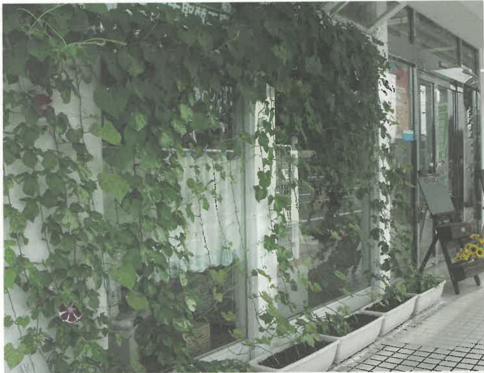
朝顔の緑のカーテンの効果もあり、部屋の中の温度は暑い日でも27℃前後 / 有限会社エダデンキ

地球を包んでいる大気には、人や動植物が生活しやすいように温度を保っている二酸化炭素(CO 2 )などの温室効果ガスが含まれています。このガスがないと、地球はとても寒くなって生き物が死んでしまいますが、逆に増えすぎると地球は暖かくなりすぎてしまいます。約二百年前の産業革命のころから、人間は石炭や石油などの化石燃料を大量に燃やし、エネルギーを得る生活を続けてきました。その結果、CO 2 が増えすぎてしまい地球全体が暖かくなっています。人が社会生活を営む上でCO 2 排出は止められませんが、このまま地球温暖化が進むと、氷河が溶け、海面の上昇により島が海に沈んだり、異常気象で災害が増えたり、農作物が取れなくなったり…。私たちの生活に大きな影響を及ぼす可能性があります。