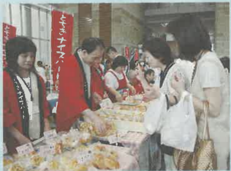
たくさんの商品が県庁ロビーに並びました