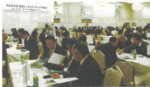
今年2月に開催された「緊急ビジネスマッチング商談会」

景気対策に重点をおきました 世界的な金融危機の深刻化に伴い、我が国経済は急速に悪化しています。本県においても、本県経済に重要な役割を担う大手企業を中心に、大規模な減産や雇用調整、事業所閉鎖が行われるなど、県内経済は非常に厳しい状況にあります。そうしたなか、県税収入が過去最大の減額となるなど、県の財政状況はかつてなく厳しいものになっていきます。そこで、事業の選択と集中を図り、さらに、県の貯金である財政調整的基金をす