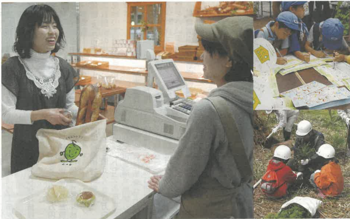
「エコポイントモデル事業」／植樹やエコ活動を実践すると、スーパーなど協力店からポイント・特典がもらえる仕組みをつくります