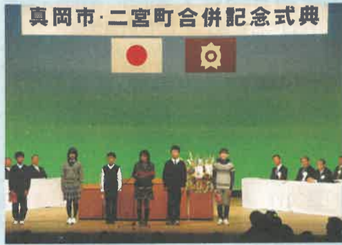
市内の小学生から、新しい真岡市へメッセージが送られました