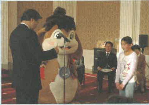
ピピモわんぱく公園からかけつけ、表彰者をお祝いしました