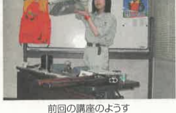
前回の講座の様子

●11/9(日)午後1時30分~4時 ●県林業センター(宇都宮市) ●講演「今なぜ『狩猟』なのか」、狩猟免許試験の実演、イノシシ鍋試食など ●受講無料 ●対象 どなたでも ●申込締切 11/4(火) ■県自然環境課 ☎028-623-3261