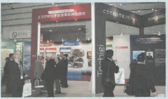
設計、機械加工、電子機器、精密部品などのとちぎの技術を世界に発信しました

十月一日から五日まで、横浜市で「国際航空宇宙展」が開催され、「とちぎ航空宇宙産業振興協議会」が初めて出展しました。この展示会は四年に一度開催されているもので、世界各国から五百二十九社・団体が参加。同協議会のブースでは「とちぎ航空宇宙クオリティ」をテーマに、県内企業二十社を紹介しました。