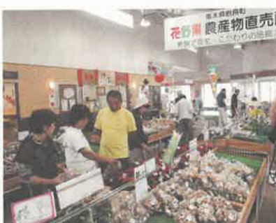
大勢の人々でにぎわう直売所。こうした施設も「食の街道」の多彩な資源のひとつ

八月には、県南地域を中心に「渡良瀬いちご・フルーツ街道」推進協議会が立ち上がり、今後、国道50号線沿いにぶどう、もも、なし、いちごなどの地元農産物を中心とした地域の団体が連携し、街道として売り出していきます。こうした