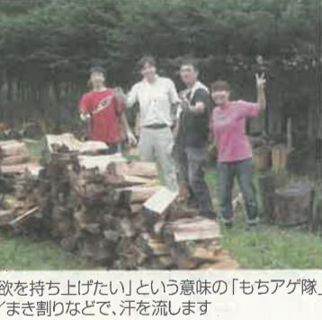
「働く意欲を持ち上げたい」という意味の「もちアゲ隊」の様子/まき割りなどで、汗を流します