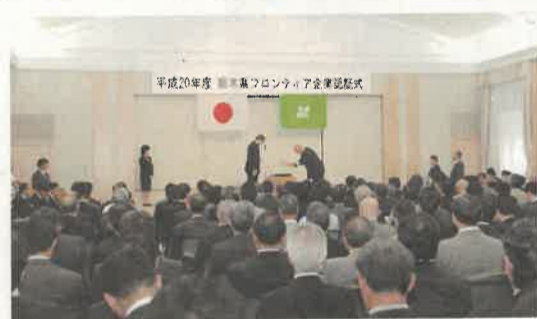
フロンティア企業認証式/ 認証を受けた190社の業種は、機械49社、電機25社、食品25社、ソフトウェア19社などです

六月十三日、県庁で「栃木県フロンティア企業認証式」が行われました。フロンティア企業とは、独自の優れた技術や市場占有率の高い製品を有する企業を県が認証したもので、いわば、本県も