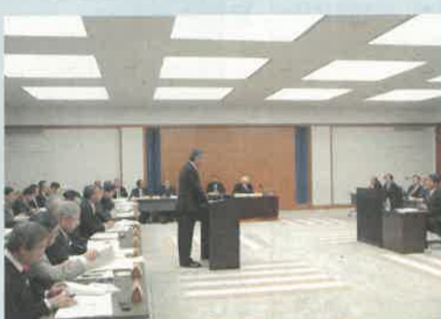
大会議室で行われた予算特別委員会総括質疑

十月一日、県議会九月定例会で予算特別委員会総括質疑が行われました。これは、県の予算や県政の重要課題について、県の執行部に対し質問するもので、今回が初めての開催です。