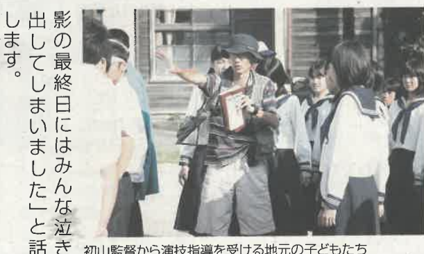
初山監督から演技指導を受ける地元の子どもたち

「那須少年記」は、昭和十九年の那須地方を舞台に、雄大な自然と心のふれあいの中で育まれる子どもたちを描いた映画です。