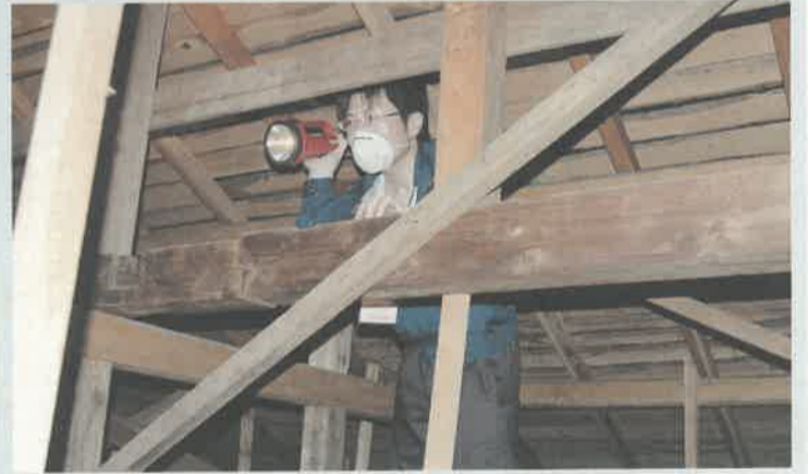
建築士による耐震診断のようす。外回りは外壁や基礎の状態が重要ポイント