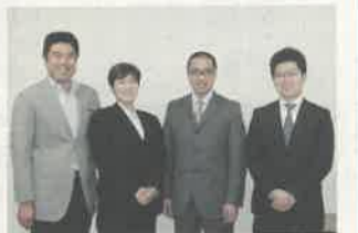
「とちぎえ〜ぞ〜支援隊」の皆さん

栃木市は蔵の街並みや豊かな自然など、映像資源の宝庫です。この栃木の良さを全国に伝えていこうと頑張っています。県外に出ている栃木市出身の人が映像を見て、故郷を思い出していただければうれしいですね。映像を見た後に、何度もそのシーンが浮かんでくる「思い出のまちかど」になるよう、魅力あるまちづくりをしていきたいと思っています。