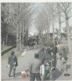
映画「キャプテン」のロケ風景 (宇都宮市駅前公園)

都宮観光コンベンション協会が、フィルムコミッションを担当している鈴木さんにお話を伺いました。「四年前にフィルムコミッションを立ち上げてから、東京から映画やテレビの撮影の相談がどとどきましました」と話します。意外なことには、古い民家や廃屋、街並みの依頼が多いとのこと。大谷採石場跡や松が峰教会も人気だそうです。