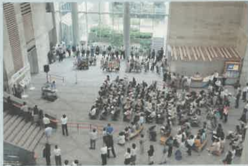
たくさんの方がおなじみの曲を口ずさみながら楽しみました