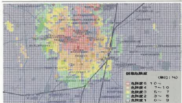
「倒壊危険度マップ」/県央を震源とした場合の危険度を色別に表したものの。各市や町でご覧になれます