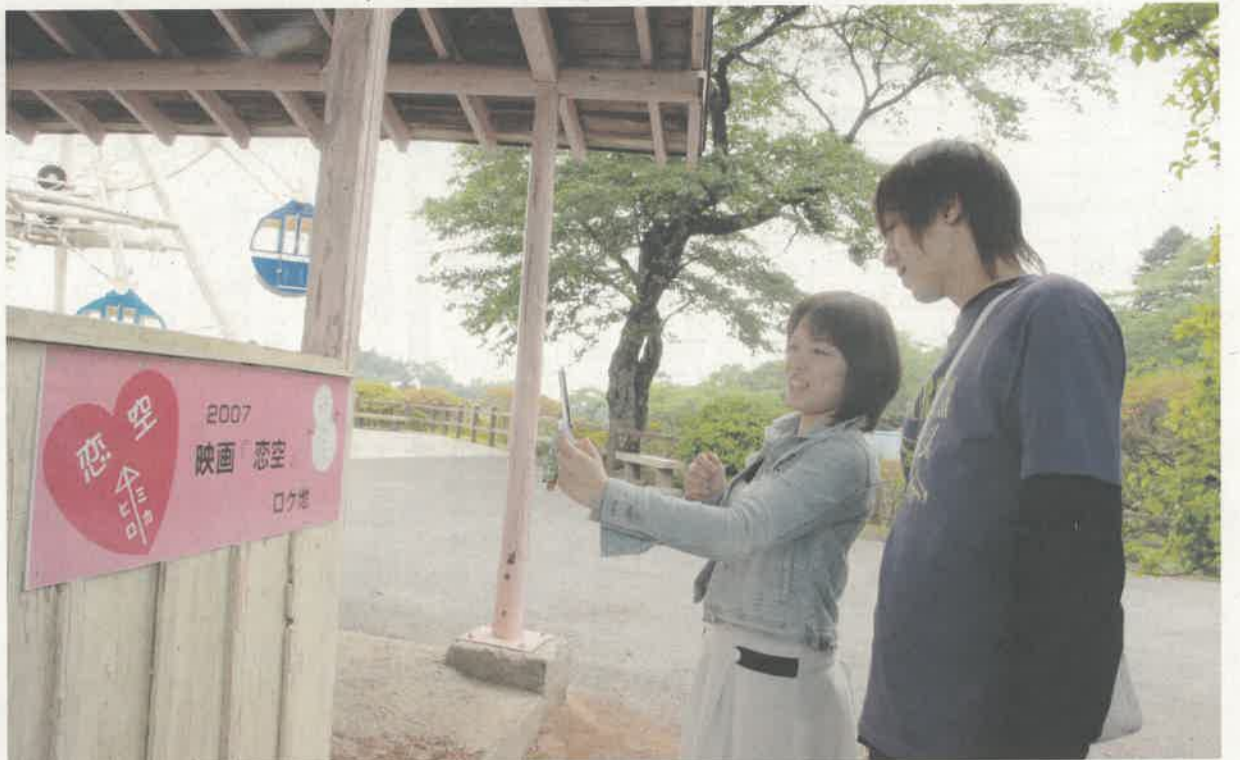
映画「恋空」のロケ地で記念写真。「友達に自慢します!」/鹿沼市千手山公園