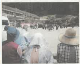
「魁!!男塾」のロケ風景。ご近所の皆さんも見学に(旧須賀川小学校)