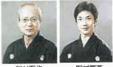
野村万作 野村萬斎

●狂言～万作の会 ●2/8(木) 午後6時 30分開演 ●S席 4,000円、A席 3,000円(学生2,000円) ●狂言講座、狂言「千鳥」「仁王」 ●出演:野村万作、野村萬斎ほか ●発売中 ●劇団四季ファミリーミュージカル「王子とこじき」 ●3/2(金)午後6時30分開演 ●S席 4,200円～C席 1,500円 ●発売中