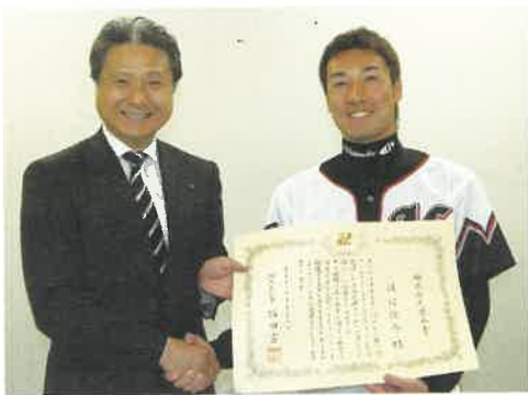
昨年行われた県民栄誉賞授与式の様子