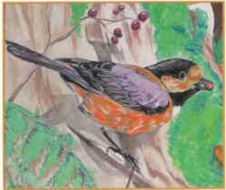
勝水里実さん(益子町・中学3年生)の作品 ※絵は「平成18年度愛鳥週間用ポスター原画 コンクール」の入賞作品です

木の実が大好きな鳥 堅い実でも 丈夫なくちばしで コツコツとついで 上手に食べます 昔はおみくじを引く 芸達者がいたそうです