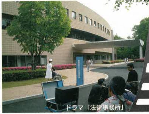
ドラマ「法律事務所」