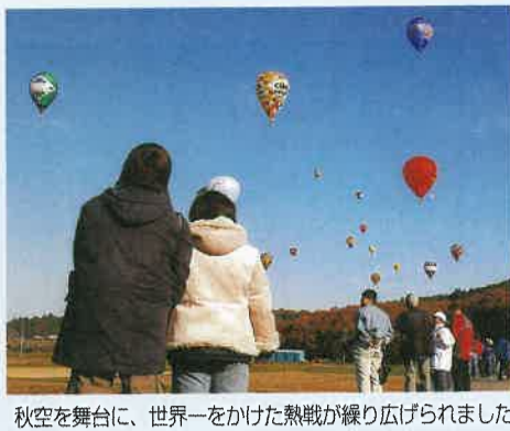
秋空を舞台に、世界一をかけた熱戦が繰り広げられました