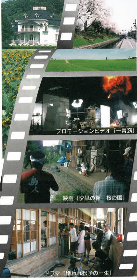
プロモーションビデオ「一青窈」