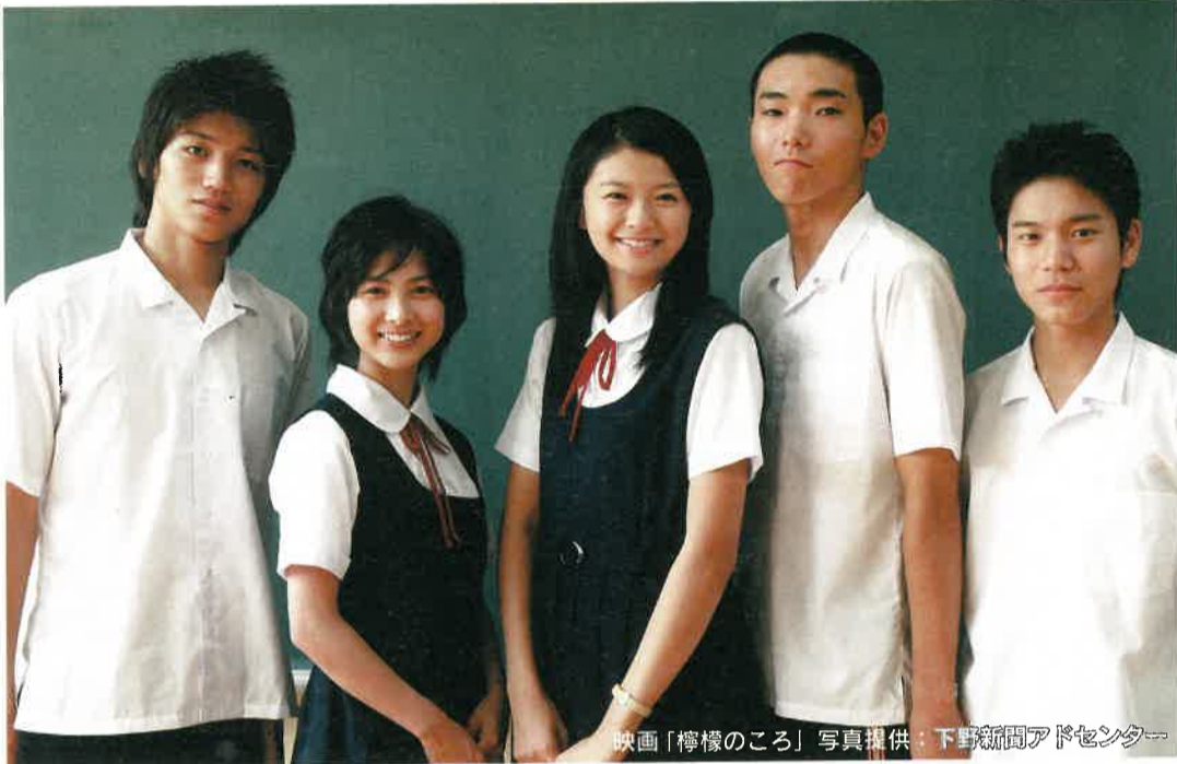
映画「檸檬のころ」

栃木県の人口 2,015,885人 (前月比+780人、前年同月比-1,545人) ◎男1,001,855人 ◎女1,014,030人 ◎世帯数720,806世帯 (11月1日現在)