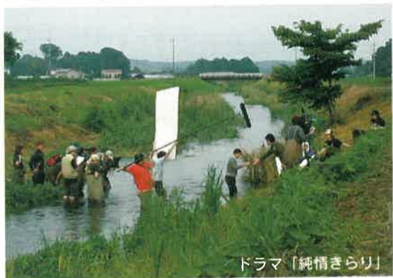
ドラマ「純情さらり」