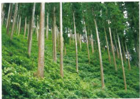
元気なスギ・ヒノキの森

県では、こうした課題に対応するために、新たな財源として森林環境税(仮称)の導入について検討をはじめました。