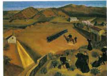
<兵隊と備前(トド外)>1925年

●清水登之のすべて ●H19/1/14(日)～3/4(日) ●栃木県出身の画家清水登之(しみずとし1887-1945)の作品、当館所蔵の120点に及ぶ油彩、水彩、素描のすべてを出品。あわせて関連する作家の作品や資料なども展示し、空前の規模で清水登之の全貌を紹介します