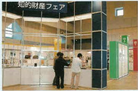
とちぎの最先端の技術や情報を持つ72の企業や団体、大学などが参加しました

県と市町村は、次代を担う青年リーダーを養成する事業の一環として、十月三十一日から十一月八日まで、「栃木県青年の船」を実施しました。これは、訪問地での研修・交流や洋上研修などを通じて、地域や世代をこえた友情を深め、幅広い視野と国際性を身に付けるためのもの。一行は、中国浙江省で中国青年との交流活動や、沖縄県の「栃木の塔」で戦没者への献花などを行いました。