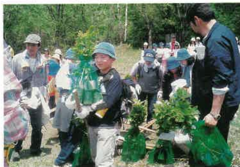
参加した子どもからは「植えた木が大きくなって、また何かに使われればいいな」という声も

森林は、土砂流出を防止したり水を蓄えたりするなど、わたしたちの暮らしを守るさまざまな働きを持っています。森林の働きを守るためには「木を植え、育て、伐って利用し、また植える」という循環が必要で、県は、この循環を円滑にすすめるため、木材利用を拡大したいと考えています。