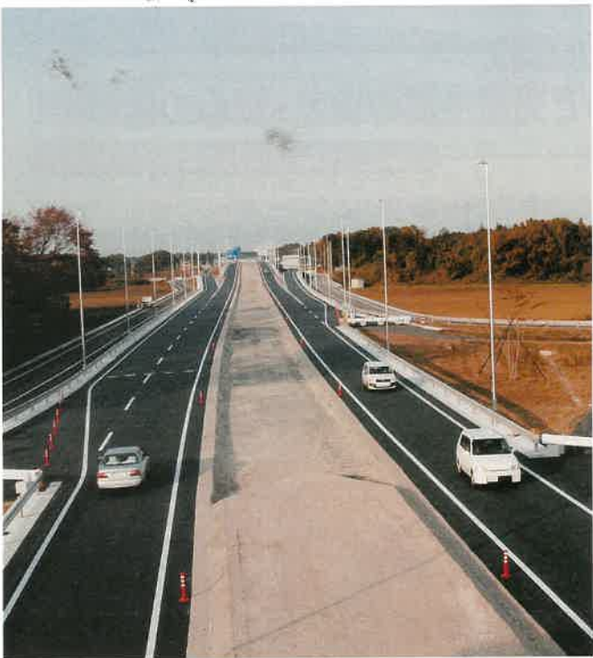
11月18日に開通した国道408号鬼怒テクノ通り「真岡バイパス」

国道408号「鬼怒テクノ通り」は、真岡市長田の県道真岡上三川線と宇都宮市氷室町の国道123号を結び延長十一キロのバイパス道路。この道路は、東北自動車道矢板インターチェンジ（IC）と常磐自動車道を結ぶ総延長約百キロの地域高規格道路（※）「常総・宇都宮東部連絡道路」の主要な部分を形成しています。沿線一帯には、真岡工業団地や清原工業団地などが控えており、それらを結び国道408号は、大型車が多く、慢性的な渋滞が起き