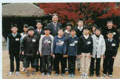
921作品の中から選ばれた「ジュニア知事さん」たち

十一月十七日~十九日、宇都宮市内でとちぎ産業フェア2005が開催されました。これは、優れた新技術や新製品などを展示、紹介する県内最大の総合産業見本市です。今年も新たに、知的財産フェアも同時開催。知的財産制度やブランド品の模倣品の見分け方などの紹介が行われました。