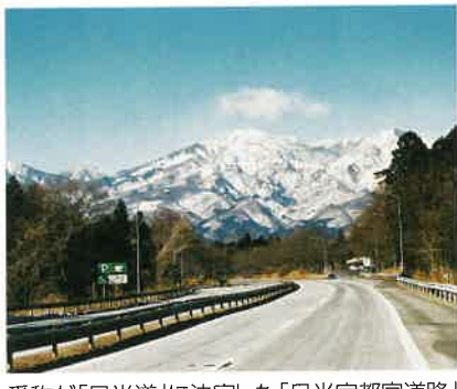
愛称が「日光道」に決定した「日光宇都宮道路」

群馬県高崎市と茨城県ひたちなか市を結ぶ全長約百五十キロの「北関東自動車道」。この道路の完成によって、移動時間が短縮されるだけでなく、首都圏から放射状に延びる東北・関東・常磐の三つの高速道路にも連結され、高速交通のネットワークがさらにすすみます。これにより、北関東三県はもとより、全国との新