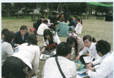
友好県提携をしている中国浙江省の青年との交流活動の様子