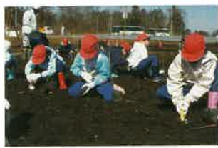
苗木の植樹活動を行う子どもたち

「地域高規格道路」とは、高速道路と国道県道などの一般道路との間に位置する道路で、高速道路ほどのスピードは出せませんが、交差点を立体化するなどして、速くたくさん車を走らせることができます。