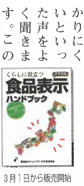
3月1日から販売開始

私たちが日常の中で何気なく目にする食品表示。そこには、産地や原材料、賞味期限など内容を理解するための重要な手がかりがいくつも記されています。しかし、食品表示にはいくつもの法律の規定があり、わかりにくいといくつもの声をよく聞きます。この