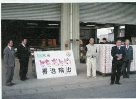
JASもつけ栃木地区営農センターのとちおとめ250ケースが出荷されました