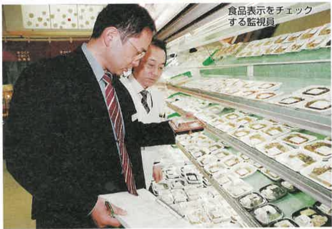
食品表示をチェックする監視員

古来から、人は食べ物を匂いや見た目など感覚的なもので判断してきました。しかし、今の日本は衛生的な環境のため、人が本来持っていた感覚的なものが段々おろそかになってきています。そのため、そういった感覚を養うとともに、消費者の皆さんには食品表示などを参考に自分で考えて、正確な知識を持ち、安全かどうかを理解していただきたいと思えます。今年は「ノロウイルス」が流行しましたが、このウイルスは昔からあったもので「手を洗う」「生ものに火を通す」といった基本的な知識があれば予防できるもの。さまざまな情報がはらんでいますが、消費者の皆さんには食品の安全性を判断し得る目を持っていただき、そして疑問に感じたことは身近な窓口でいつでも相談して欲しいですね。