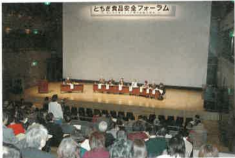
1月31日、宇都宮市内で開催された「食品安全フォーラム」では、食に関するさまざまな意見交換がされました