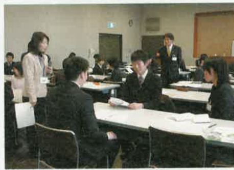
面接ロールプレイングでは、参加者の皆さんが真剣な表情で面接練習を行っていました