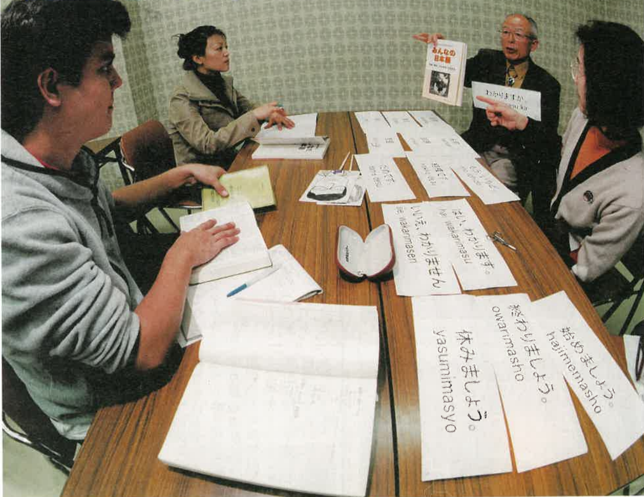
小山市国際交流協会の日本語教室「にほんごとびらの会」/小山市中央公民館 ブラジル、ペルー、中国、インドネシアなどさまざまな国の方がそれぞれの進度に合わせて日本語を学んでいます。日本語教室は第1・2・3金曜の午後7時から8時30分まで開講しています