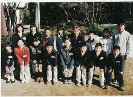
「大人では思いつかない提案があり、これからの活躍が楽しみです」と知事が期待を語りました