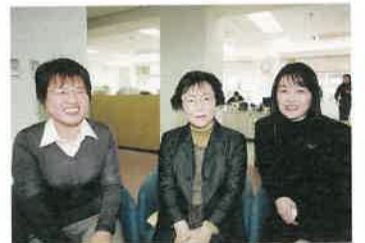
国際交流相談員の皆さん

身近に外国の方が暮らしていたら、あいさつをして地域ぐるみでコミュニケーションをとっていただきたいです。また、自治会の回覧板にふりがながあれば、日本人も外国の方ももっとわかり合えるのではないのでしょうか。