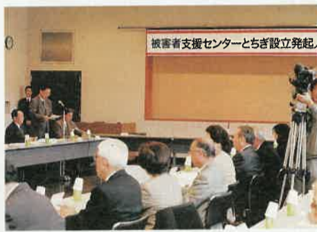
県をはじめ58団体が発起人となり、連携をとりながら活動していきます