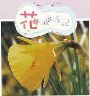
スイセン(ヒガンバナ科)

水辺に清楚に咲く仙人のような花。水仙の語源は擬人的です。学名もまた同様、水鏡に映った自分を溺愛する「ナルキッサス」。横向きの花は水面をのぞき込む少年の姿なのです。