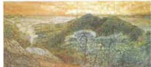
松本哲男「輝・佐野」1995年 佐野市中央公民館蔵