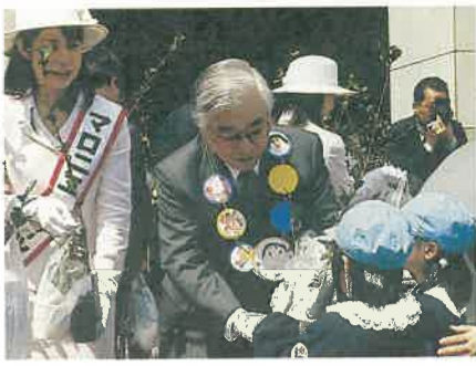
●「緑いっぱいのとちぎに」と苗木を配布