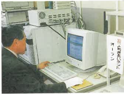
●あいネットのオープニング(3月29日)