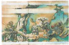
風俗図鑑 江戸時代