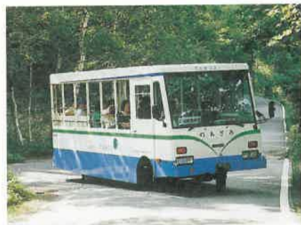
●新緑の中を走る電気バス「のあざみ」