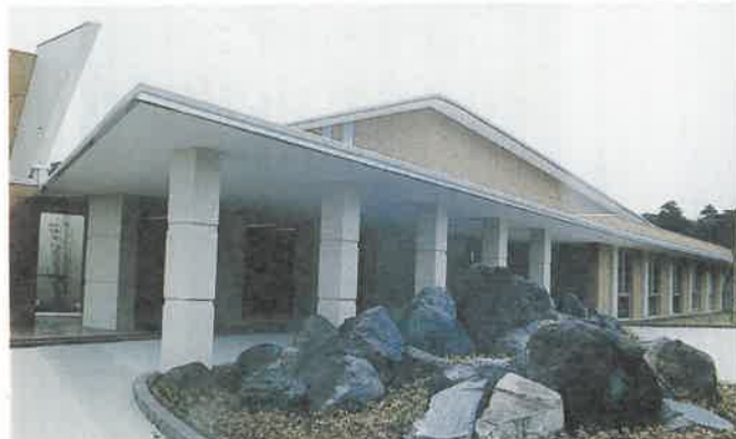
●県産業技術大学校県北校