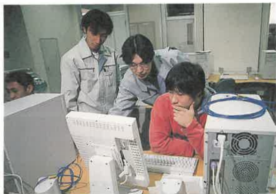
●小人数制による、きめ細かな指導

県北校では、主に高卒者を対象とする二年制の普通課程に、三つの訓練科を設けています。各科とも一学年二十名という少人数制を採用し、きめ細かい教育訓練を行います。