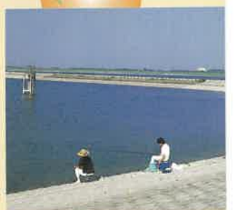
緑の大地 ふじおか