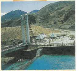
銅山の歴史と豊かな自然の町