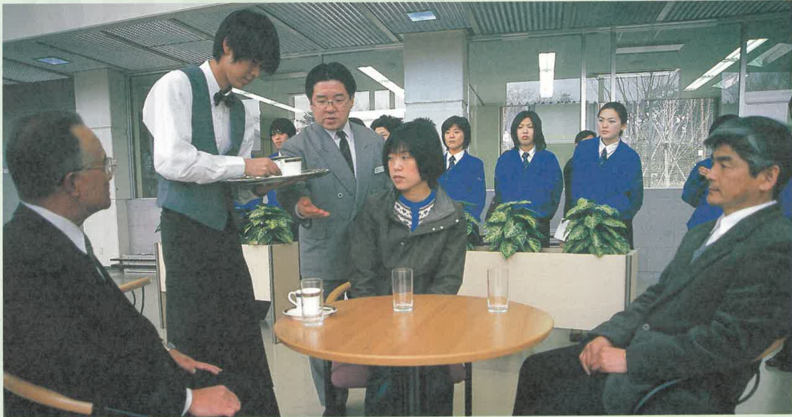
●ホテル勤務経験者の指導による接客実習のようす