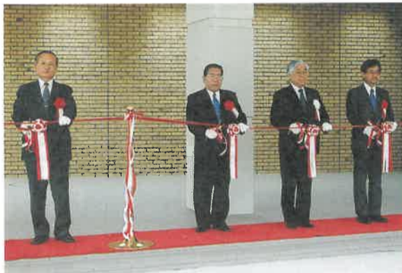
●開校式典でのテープカット

県北校は、那珂川の河畔、松林に囲まれた豊かな自然の中に建設されました。敷地面積は三万五千四百平方メートル。建築面積は五千四百平方メートルで、二階建ての本館のほか、実習棟、講堂、職業能力開発センター等の施設が機能的に配置されています。那須地域の自然や景観に配慮して整備された訓練施設には、最新鋭の訓練用設備・機器が備えられています。