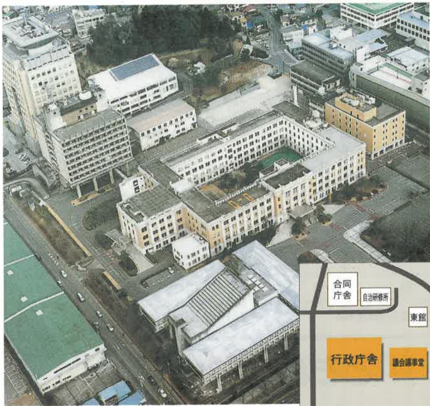
●現在の県庁舎(写真上)と新県庁舎の配置案(右)

県では、今年三月、県議会や県民懇談会の提言などを踏まえ、「新県庁舎整備計画」を策定しました。