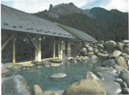
●ハーブ風呂や日光連山を望む露天風呂がある