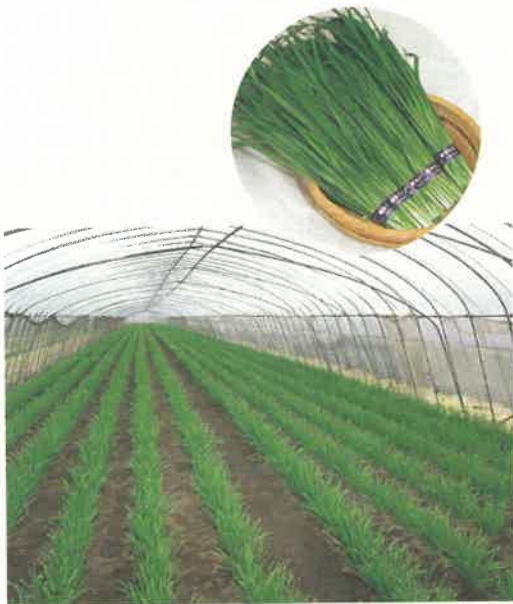
〈施設化が進むとちぎの野菜〉

さらに、今年度から新たに「首都圏農業確立対策ローリングプラン」を作成し、生産者、農業団体、関係機関が一体となつて園芸振興の目標達成に向かって活動を開始しました。