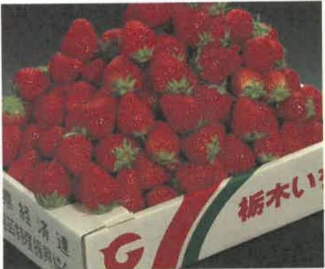
〈全国第1位のとちぎのいちご〉

栃木県は比較的災害が少なく、豊富な水に恵まれており、さらに冬季の日照量が全国でも上位にあります。この自然を生かしていき