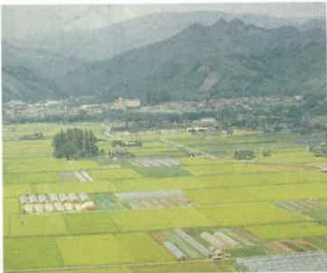
〈整備が進むとちぎの水田〉

水田には連作障害がないことから、水田文明は永遠であり、畑作文明は有限であると言われています。本県の広い耕地面積の77%は水田です。この水田を輪作にするなどの活用方法によって、園芸作物の産地化を図っていきます。