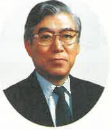
栃木県知事 渡辺 文雄