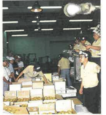
〈出荷されるとちぎの園芸作物〉