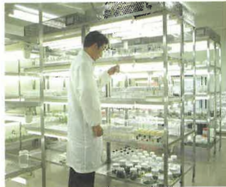
〈新しい技術の開発〉

か高まっています。これに添えて、これからは首都圏に旬(季節)を届ける園芸作物の産地「とちぎ」の確立を図っていきます。