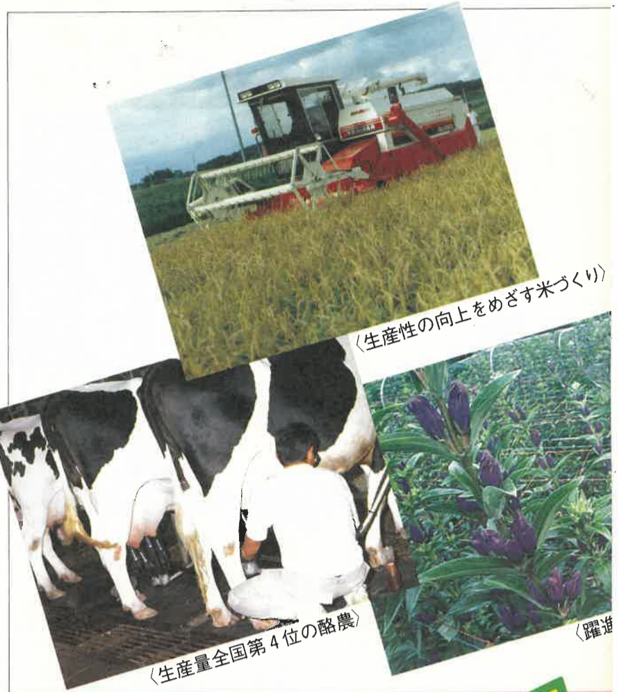
〈生産性の向上をめざす米づくり〉