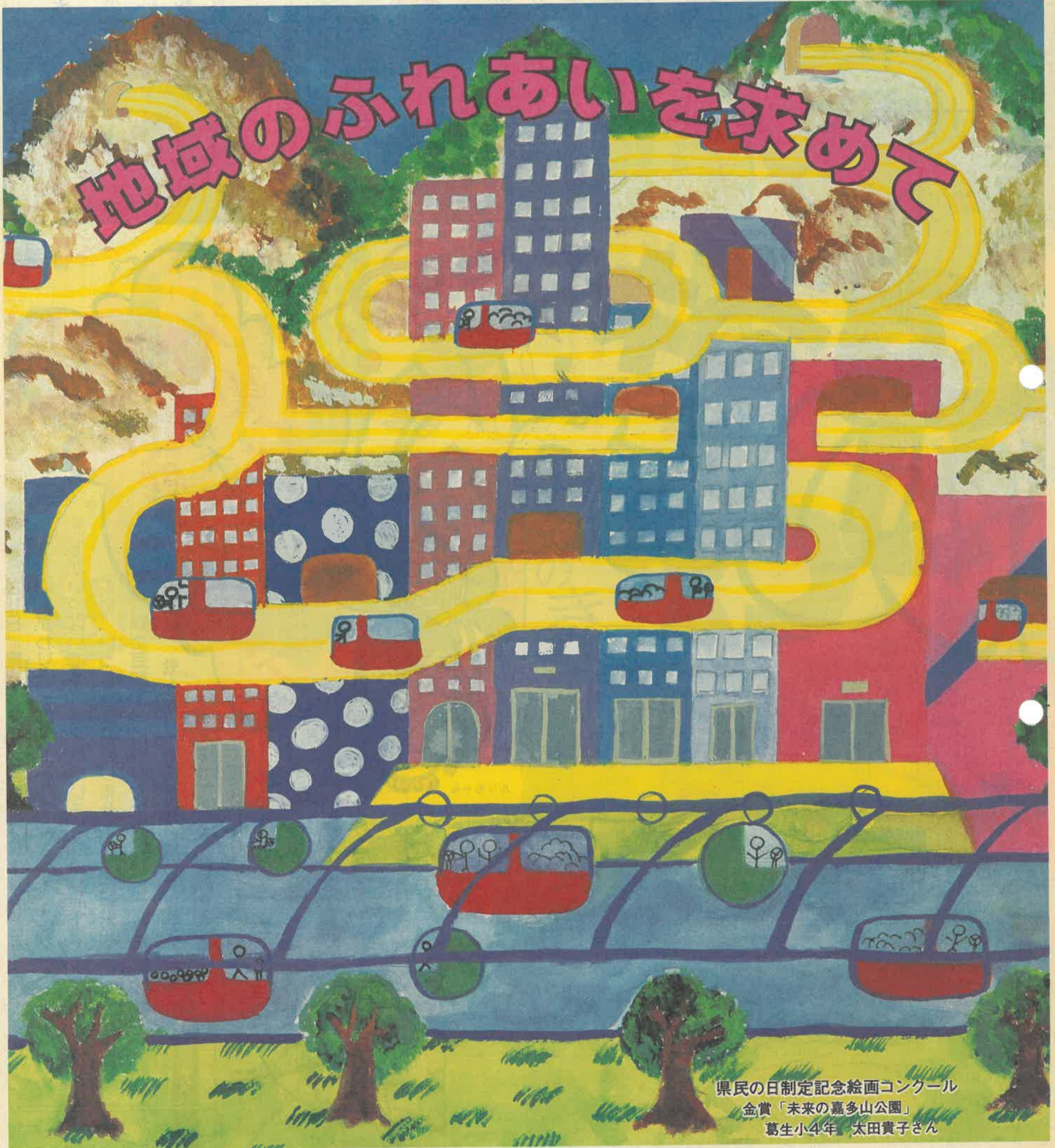
県民の日制定記念絵画コンクール 金賞「未来の嘉多山公園」 葛生小4年 太田貴子さん

●昭和61年6月3日発行 ●編集・発行／栃木県企画部広報課 〒320 宇都宮市埴田1丁目1番20号 ☎0286-23-2159 ●県人口/1,868,783人 男925,466人 女943,317人 ●世帯数522,876世帯(昭和61年4月1日現在 概数)