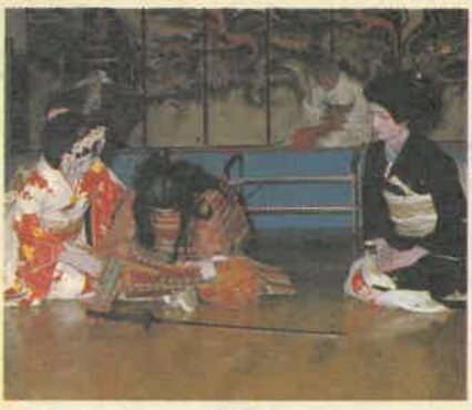
● 葛生の牧歌舞伎(牧歌舞伎保存会)