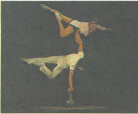
● 中国浙江省文化芸術団公演 午後0時30分～2時30分