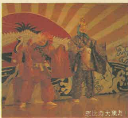
● 川俣の三番叟、恵比寿大黒舞(川俣民俗芸能保存会)