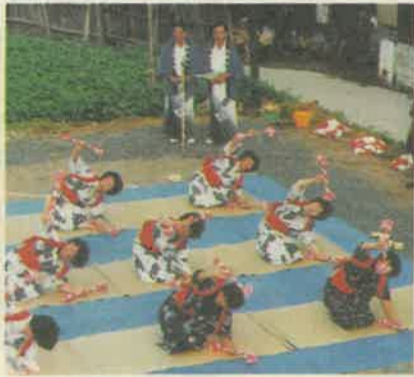
● 茂木の百堂念仏(百堂念仏保存会)