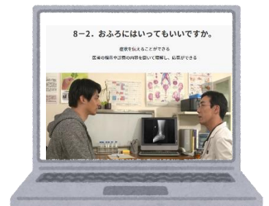
文部科学省 日本語学習サイト