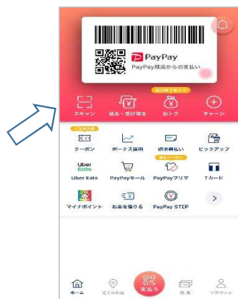
①スキャンをタップ