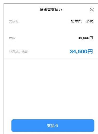
③内容を確認し、支払うをタップ