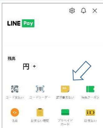
①「請求書支払い」をタップ