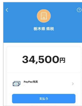
③内容を確認し、支払うをタップ