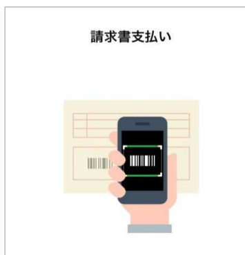
②案内を読んで次へ進み、 バーコードを読み取る