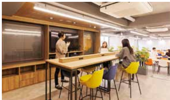
《 エントランスラウンジ 》