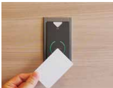
《 カードリーダー 》