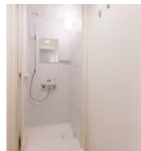
《 シャワールーム 》