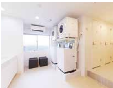
《 洗濯洗面室 》