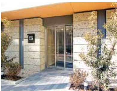
《 エントランス外観 》