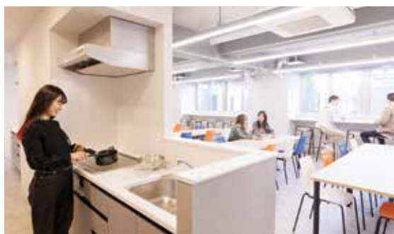
《 キッチン 》