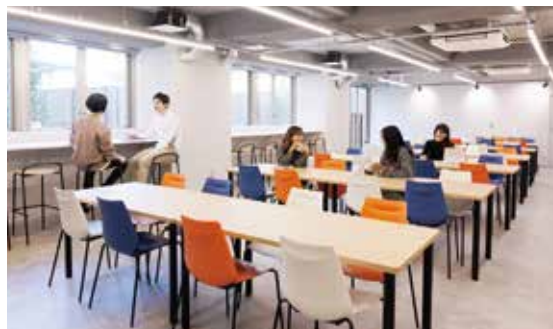
《 食堂（コモンズ） 》