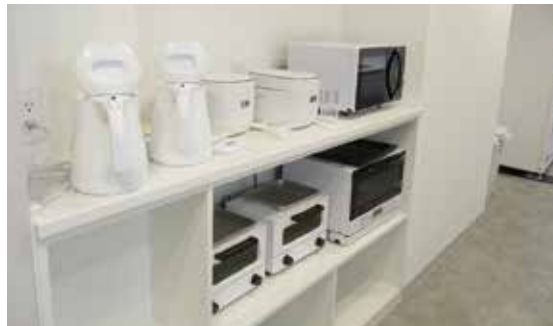
《 調理家電 》