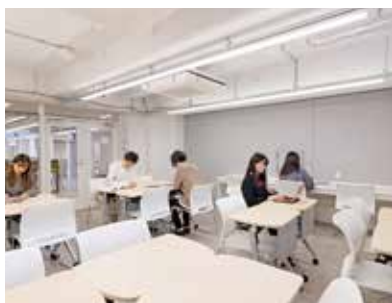
《 スタディシアター 》