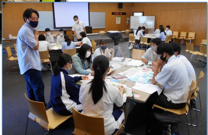
【まちづくりワークショップの様子】→ (上三川町)