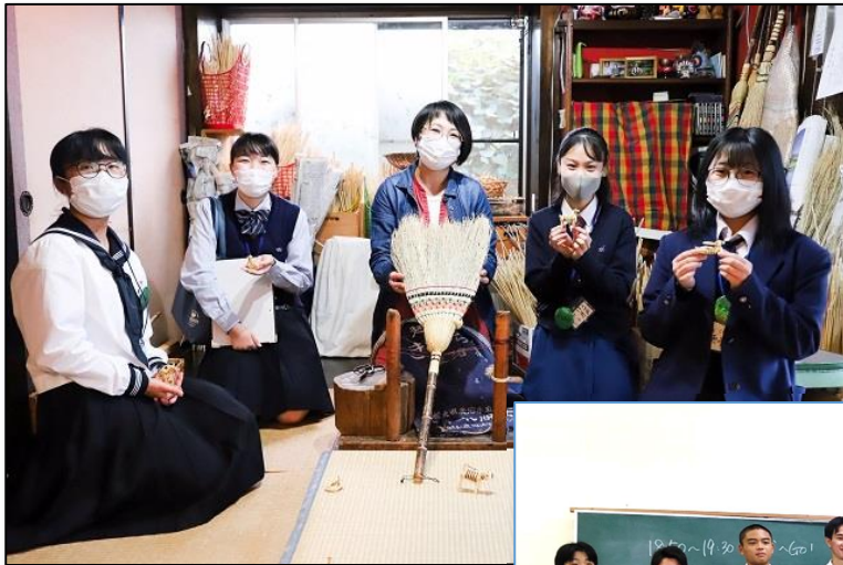
←【伝統工芸「鹿沼箒」取材の様子】 (鹿沼市)