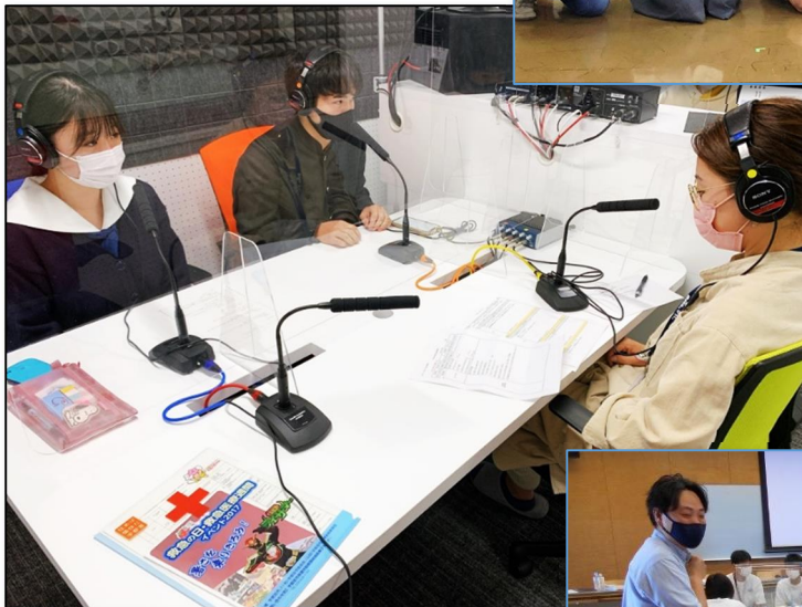
←【コミュニティラジオ出演の様子】 (真岡市)