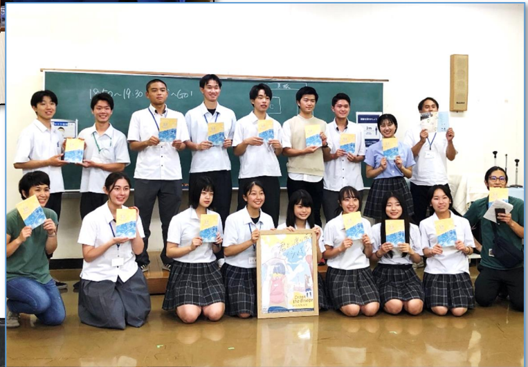
【まちあるきマップ完成の様子】→ (下野市)