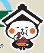
栃木市マスコットキャラクターとち介