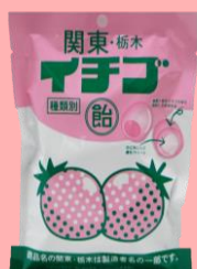
関東・栃木イチゴ飴