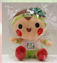
とちまるくん人形（大）