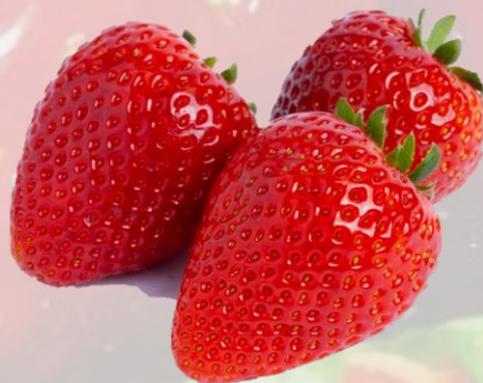
生いちご 「とちあいか」