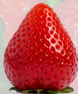
生いちご 「スカイベリー」