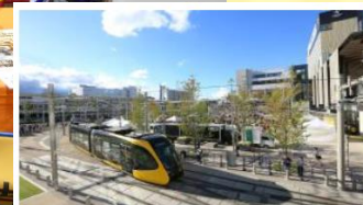
#宇都宮という選択