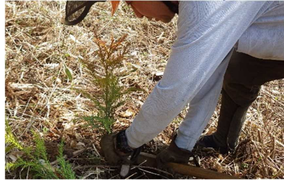
スギコンテナ苗の植栽