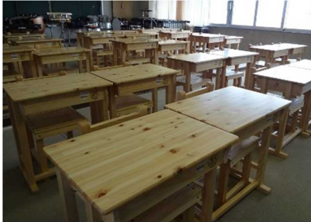
木製学習用机・椅子の整備