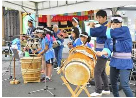
天明鑄物と佐野の手仕事フェア