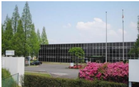
↑シミックCMO株式会社 足利工場