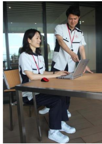
オープンなコミュニケーション