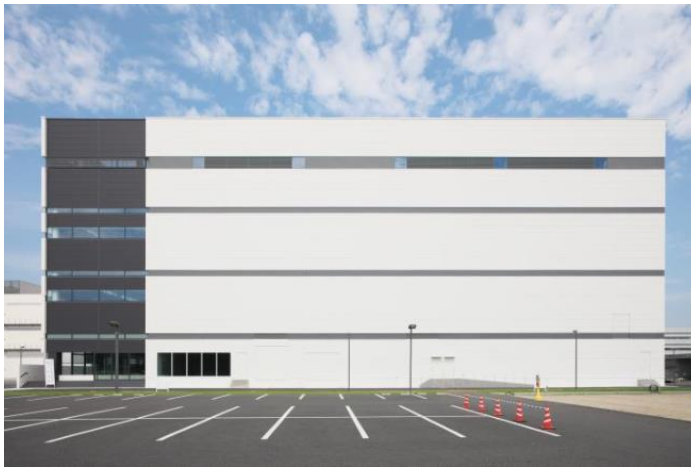
さらなる海外増産体制を見込んだ新製造棟が完成（2025年竣工）