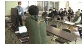
データを活用したスマート農業の取組（高知大学）