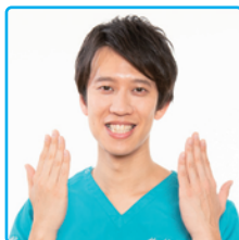
しゅんしゅんクリニックP (栃木県にゆかりあり)