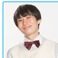
鬼ぶりん・ピッピー大谷 (塩谷町出身)