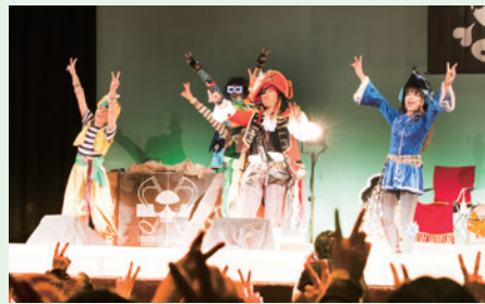
※ステージスケジュールは予告なく変更となる場合がございます。