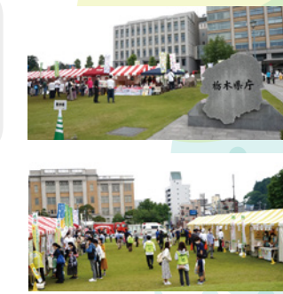
※掲載写真はイメージとなります。