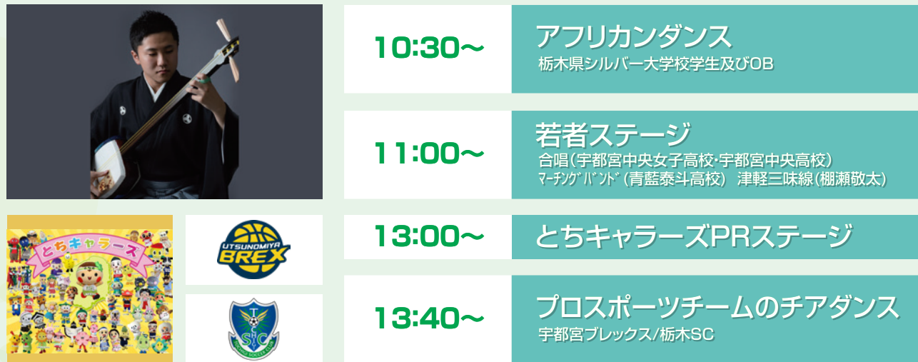
※ステージスケジュールは予告なく変更となる場合がございます。